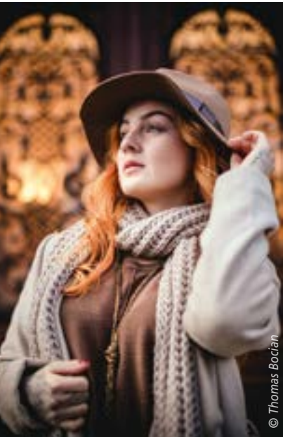
Porträt im natürlichen Licht – 13.06.

VHS der Stadt Duisburg Steinsche Gasse 26 47051 Duisburg Tel. 0203-283 949 77