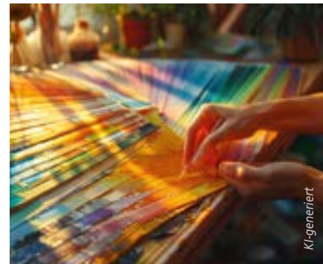
Kleidung kreativ reparieren und umgestalten – 20.06.

Workshop mit Caroline Sell Sa, 20.06., 13:00-17:00 Uhr, 35 €