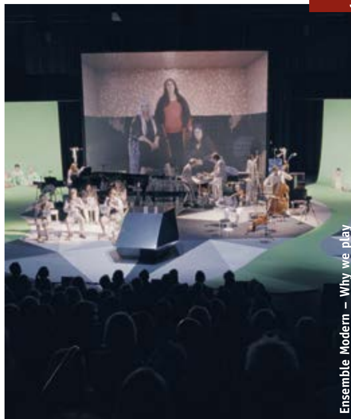
Ensemble Modern – Why we play

Queerfilmnacht Drei Frauen und ein Esel: