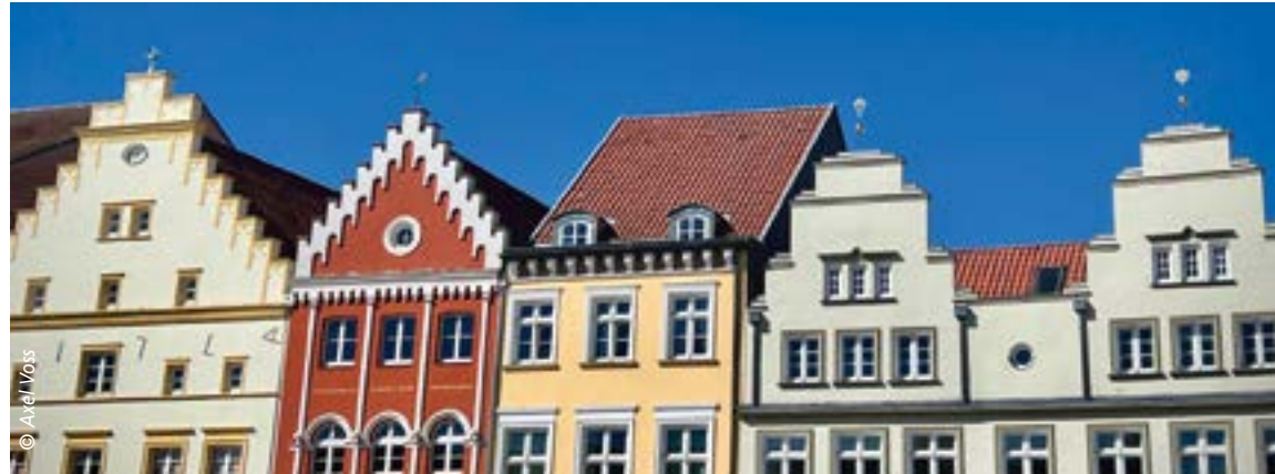
Fassaden, Formensprache und Strukturen: Architekturfotografie vom Weitwinkel bis zu Detailaufnahmen – 14.06.