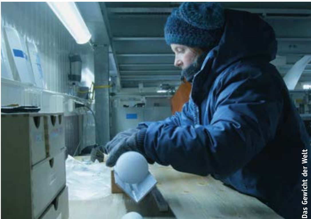
Das Gewicht der Welt