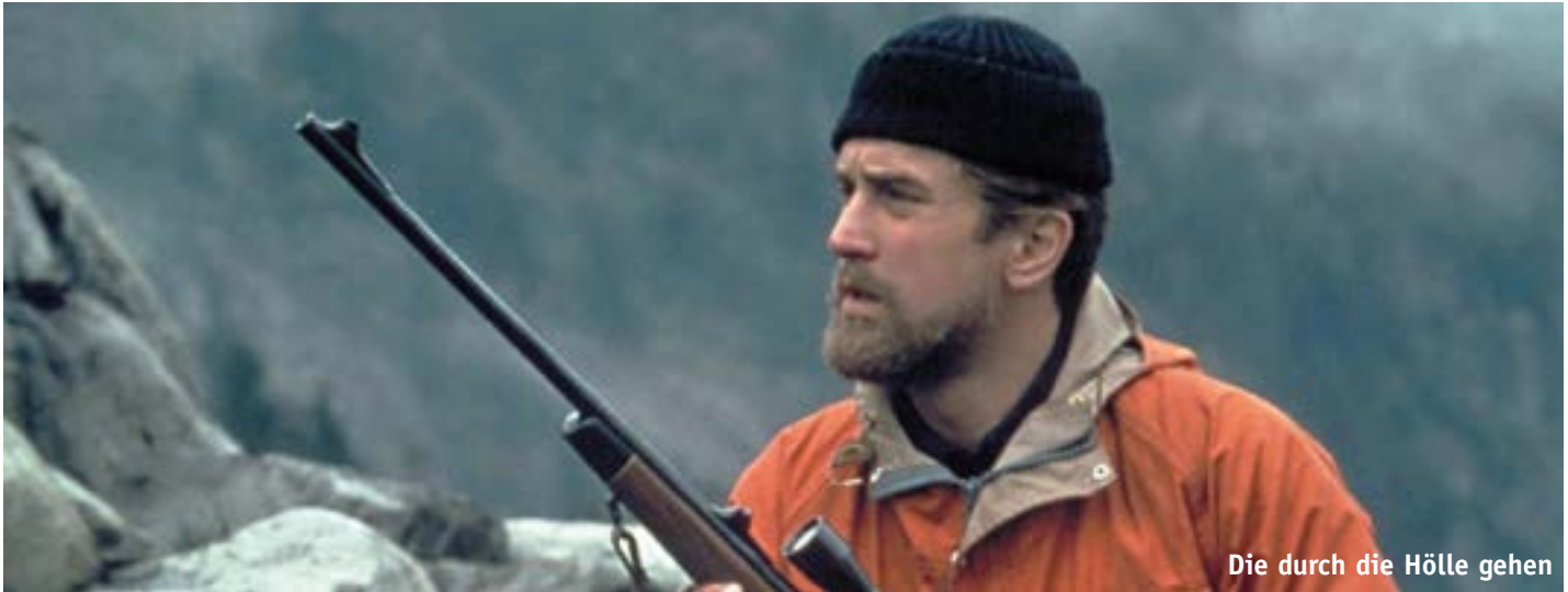
Die durch die Hölle gehen

Einer muss ja schuld sein an der Pandemie: