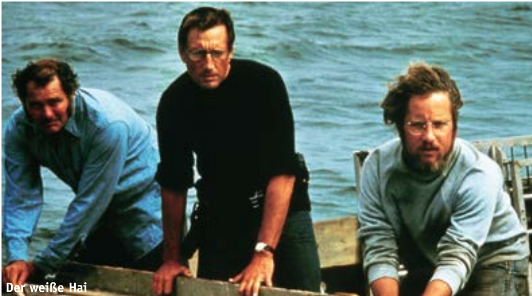
Der weiße Hai

Spieler im Klub, Rücksicht nehmen sollte. Wo das Thema einmal auf dem Tisch ist, will es auch so heiß gegessen werden, wie es hoch gekocht wurde. Das macht Spaß und ist trotzdem ernst gemeint.