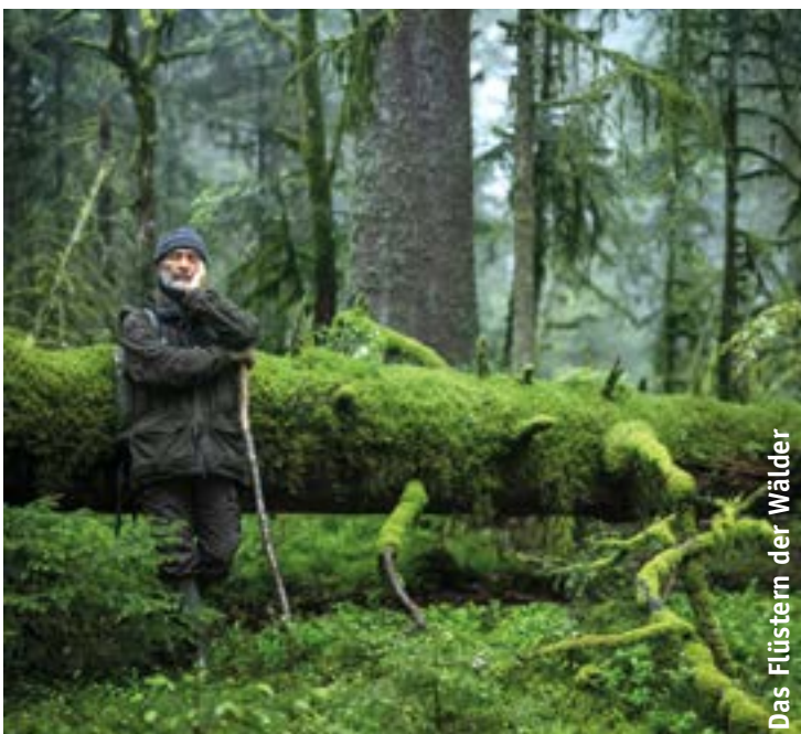
Das Flüstern der Wälder