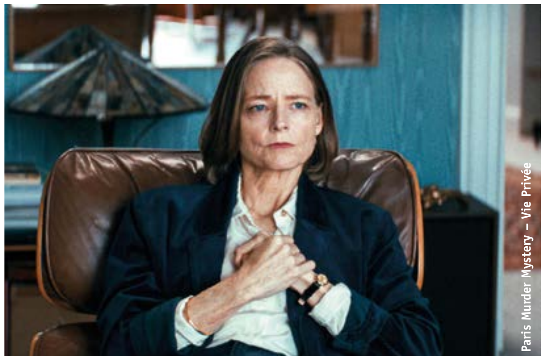
Paris Murder Mystery – Vie Privée