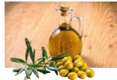
Flüssiges Gold – Olivenöltasting – 09.05.

Tasting mit Adil Daval Sa, 09.05., 14:00-16:15 Uhr, 30 €