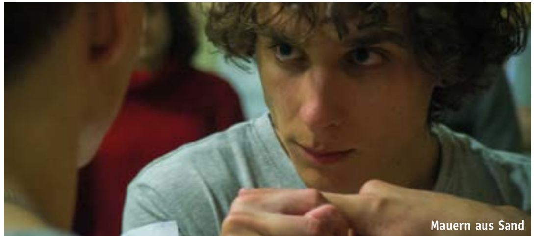
Mauern aus Sand

Mädchen und junge Frauen im Alter von sechs bis 19 Jahren schauen sich Bilder einer Ausstellung im Leipziger Kunstmuseum an. Sie sagen, was sie sehen. Die Regisseurin Shelly Silver nimmt in ihrer Dokumentation GIRLS/MUSEUM die