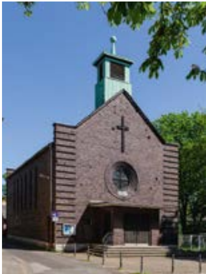
Führung durch das Museum St. Laurentius – 21.05.

VHS der Stadt Duisburg Steinsche Gasse 26 47051 Duisburg Tel. 0203-283 949 77